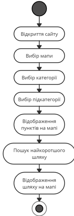
Рисунок 1 – Діаграма активності на верхньому рівні деталізації роботи системи

Нижче наведено приклад діаграми активності на верхньому рівні візуалізації роботи системи: